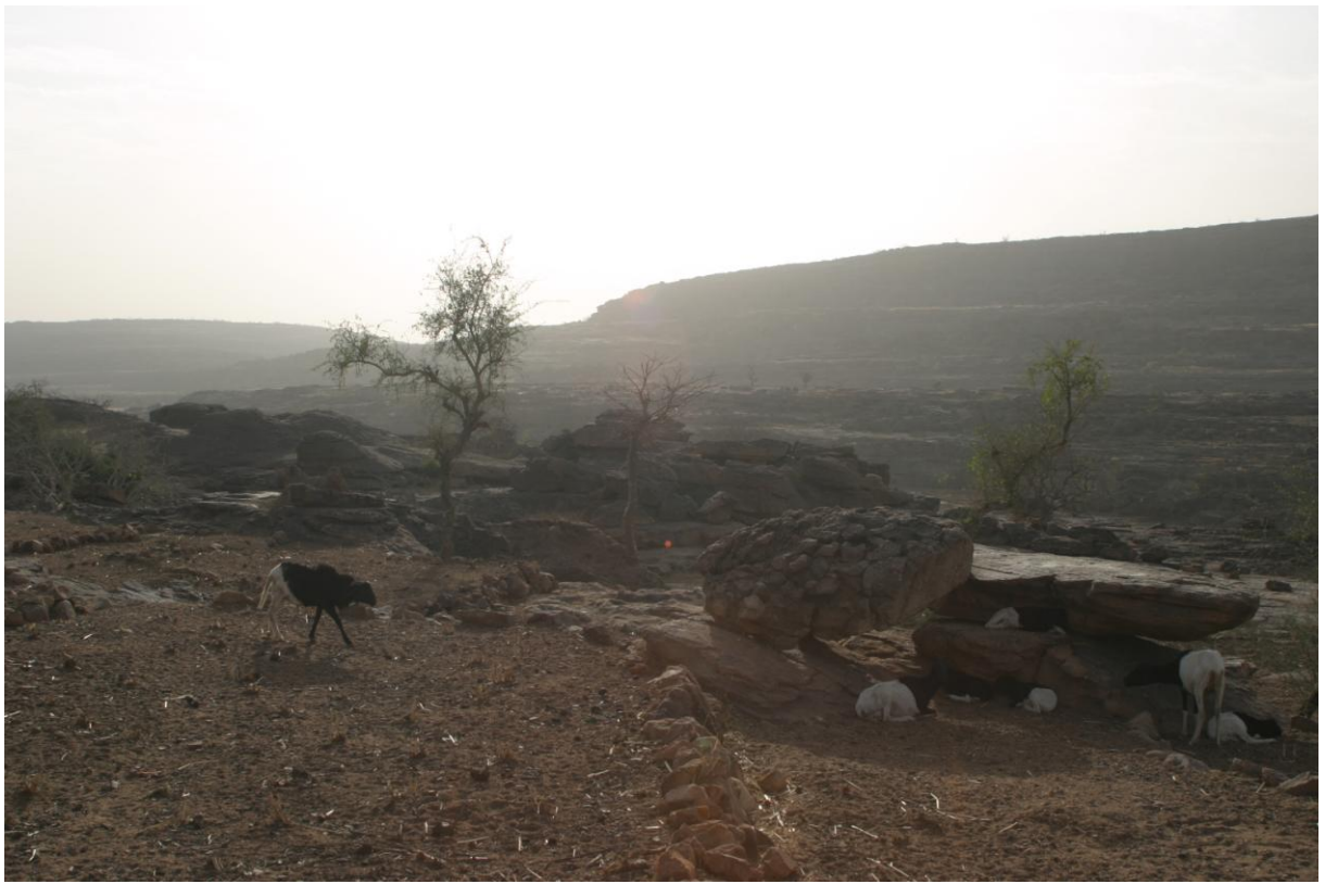
PHOTO 3 : plateau et sécheresse. De ce village de Kaoli les femmes font 15 km à pied pour apporter de l'eau au village. Zone de prospection n°3