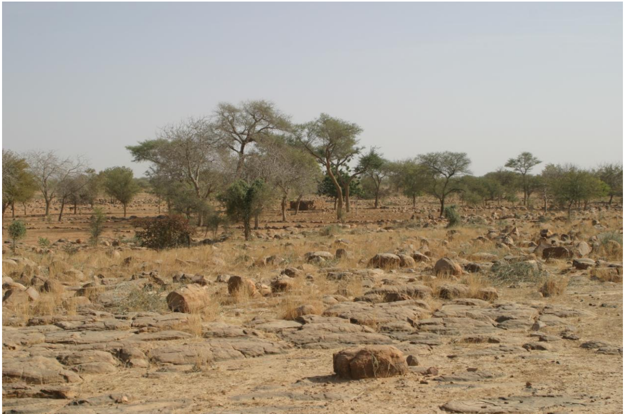
Photo 3 Vers l'ouest, quelques arbres secs sur le plateau : zone n°2