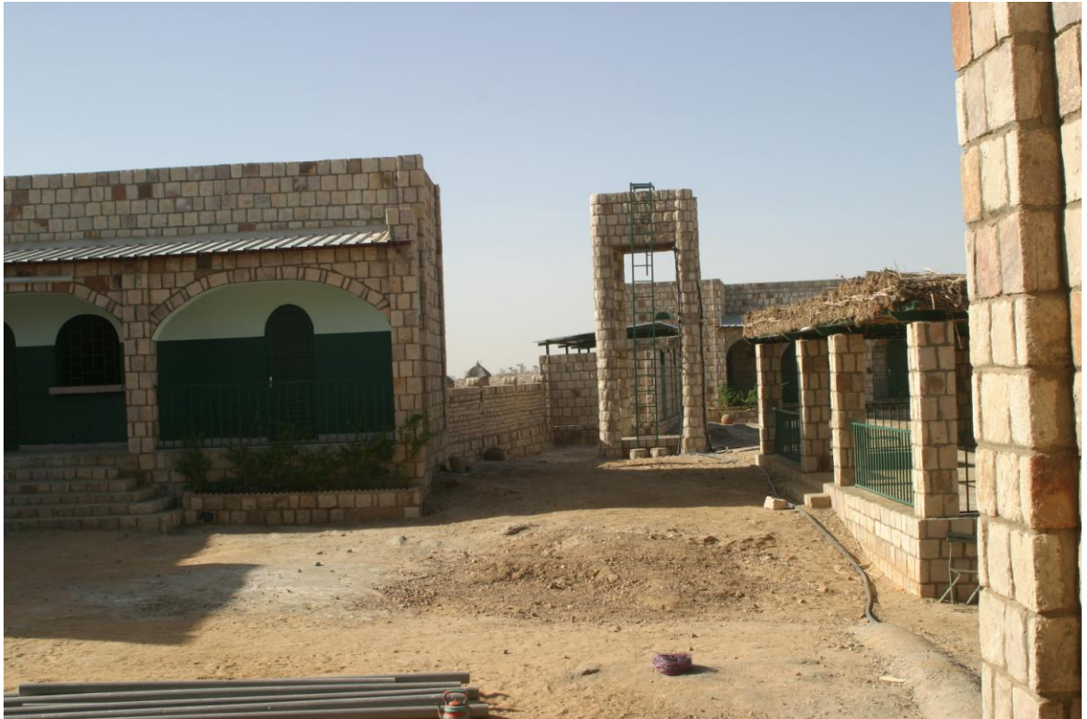
PHOTO 2 : Hôpital construit sur la piste de Bandiagara qui ne peut démarrer faute d'eau : site de la zone n°2